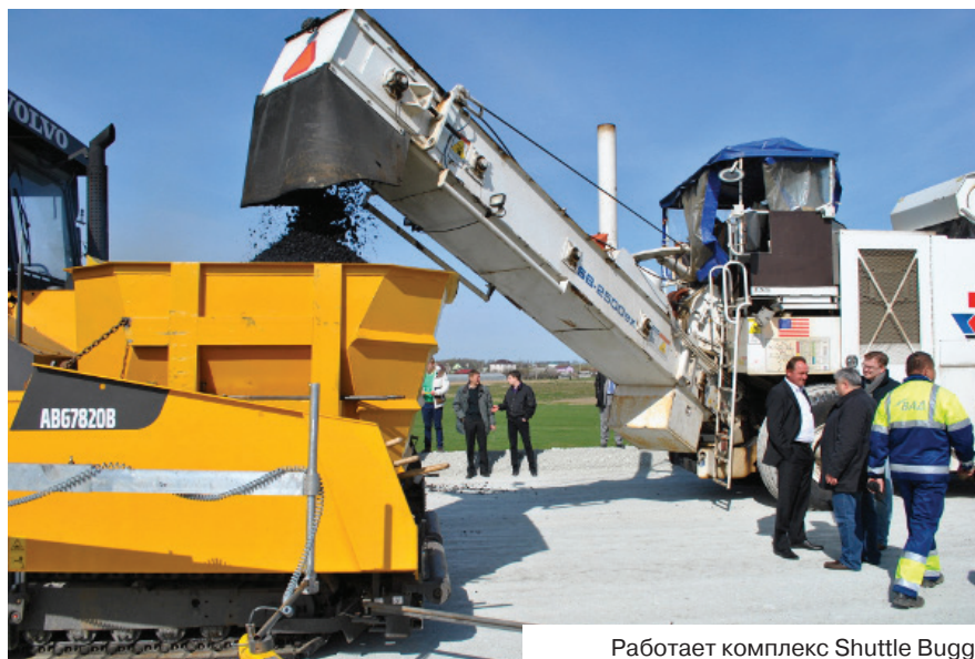
Работает комплекс Shuttle Buggy